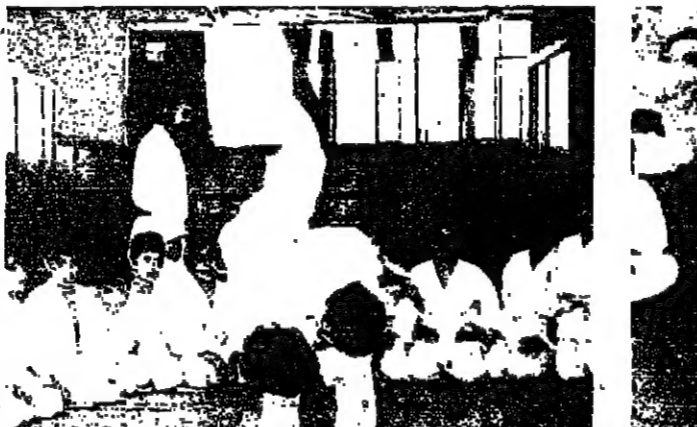
والصغار ايضا يتبارون في فن الجودو